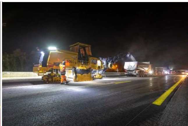
Rabotage de l'ancienne chaussée