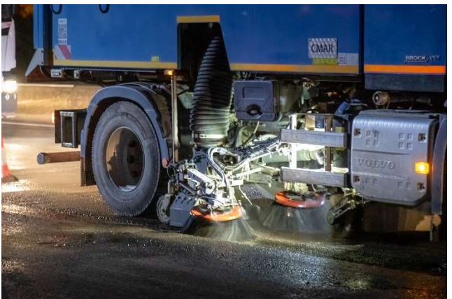
Nettoyage de la chaussée par balayuses très haute pression