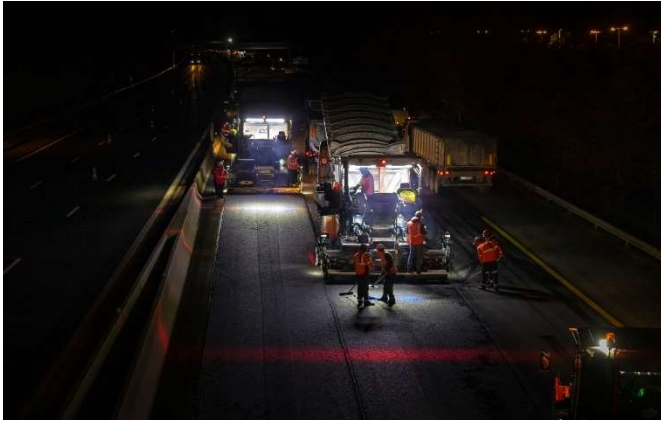
Mise en œuvre des enrobés