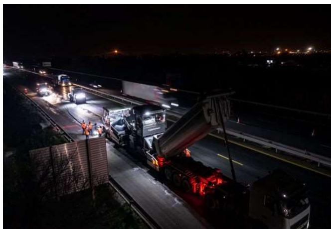
Application des enrobés drainants neufs