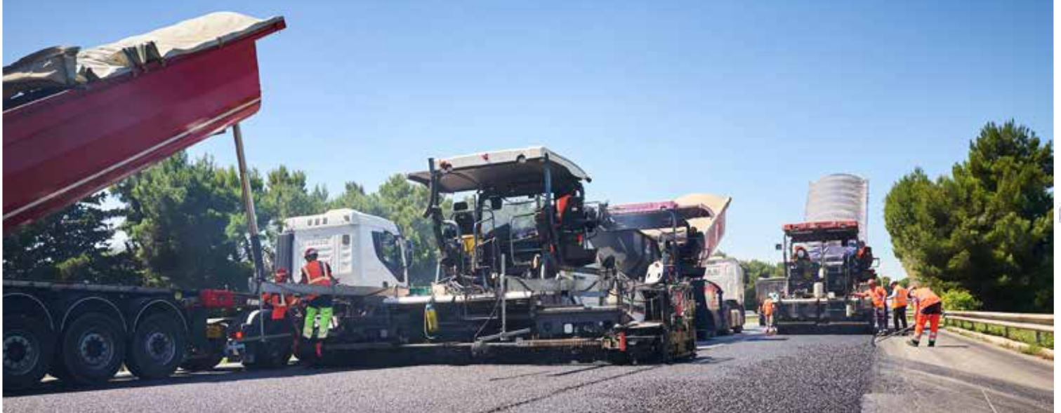
Novembre 2020 - Conception / Réalisation : Kowenolt - Crédits photos : Jean-Philippe MOULLET.

L'autoroute A9 est un maillon structurant à l'échelle nationale et internationale, un axe essentiel aux échanges européens. VINCI Autoroutes va rénover intégralement 32 km (16 km par sens de circulation) de chaussées entre les échangeurs de Nîmes Ouest (n°25) et Gallargues (n°26).